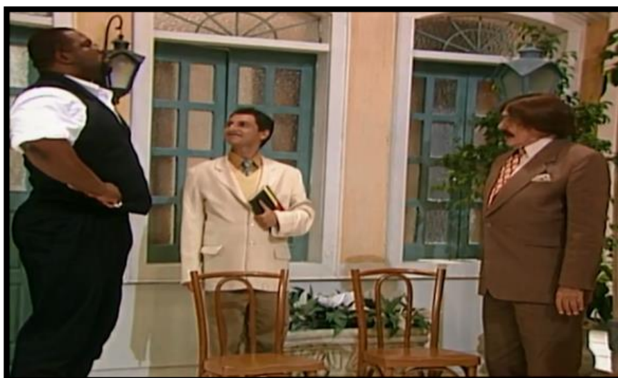
IMAGEM 9 – CANAVIEIRA É À FORÇA QUE SUPERA PROBLEMAS (1996)