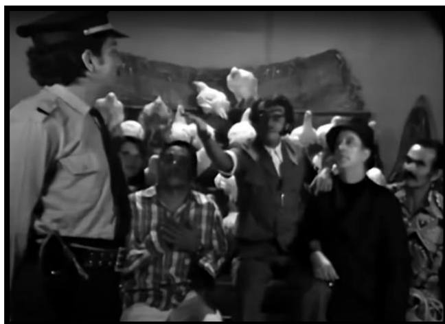
IMAGEM 10 – SETEMBRINO E A SOLUÇÃO PARA CHICO CITY (1973)