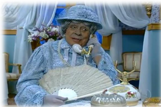
IMAGEM 7 – SALOMÉ E A LUTA CONTRA OS “HOMENS BOMBA” (07/05/2011)

No primeiro mandato da Presidente o cenário político em 2011 foi marcado por uma faxina ministerial realizada por Dilma Rousseff que, para combater a corrupção, afastou sete ministros, seis desses por denúncias de irregularidades. O que fez com a taxa de aprovação do governo Rousseff no primeiro mandato fosse alta, superando seus antecessores Luiz Inácio Lula da Silva, do PT e Fernando Henrique Cardoso, do PSDB (Valor, 2011). E foi nesse contexto que o humor político de Salomé foi ao ar novamente, desta vez, no programa Zorra Total (MemoriaGlobo, 2021I).