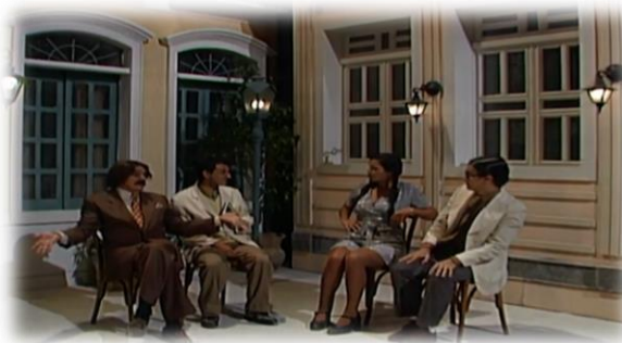
IMAGEM 2 – PERSONAGEM WALFRIDO CANAVIEIRA (1996)

Canaveira volta ao ar em 1996, mas no programa Chico Total, que traz vários personagens populares da Chico City da década de 1970, mas agora em um contexto democrático, com eleições municipais em todo o território brasileiro e pela primeira vez com a utilização das urnas eletrônicas (governo FHC), conforme TREPR (2024).