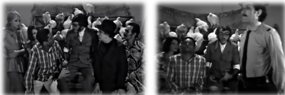
IMAGEM 3 – PERSONAGEM “ESQUERDINHA” - SETEMBRINO (1973)

No auge da repressão vai ao ar, no programa Chico City, mais um tipo criado por Chico Anysio: “esquerdinha”. O personagem fazia o jornal de oposição ao prefeito Walfrido Canavieira (1973) e mais tarde voltou como Setembrino o político subversivo (Baurutv, 2016). Para se esquivar da censura e de pressões impostas por prefeitos brasileiros, Chico Anysio destacou que Chico City não era no Brasil, porque no Brasil não havia prefeitos ladrões, porém, fora do Brasil todos roubavam (Anysio, 1993).