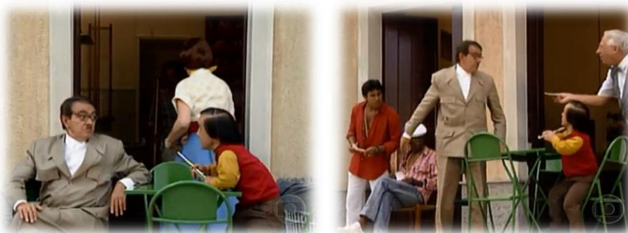
IMAGEM 4 – PERSONAGEM SETEMBRINO REPUBLICANO (1991)

Se em 1973 a atmosfera democrática destacou-se pela repressão, perseguição política e tortura, conhecido como os “Anos de Chumbo (Câmara, 2014). No ambiente democrático de 1991, tendo como presidente da República do Brasil, Fernando Collor, que entre outras promessas de campanha prometeu acabar com os marajás no País, com as mordomias e o Estado-clientela (Mendes, 1992). Nesse contexto, o programa Estados Anysios de Chico City resgata o personagem Setembrino para atuar com novos bordões, mas em uma nova conjuntura política: a era Collor.