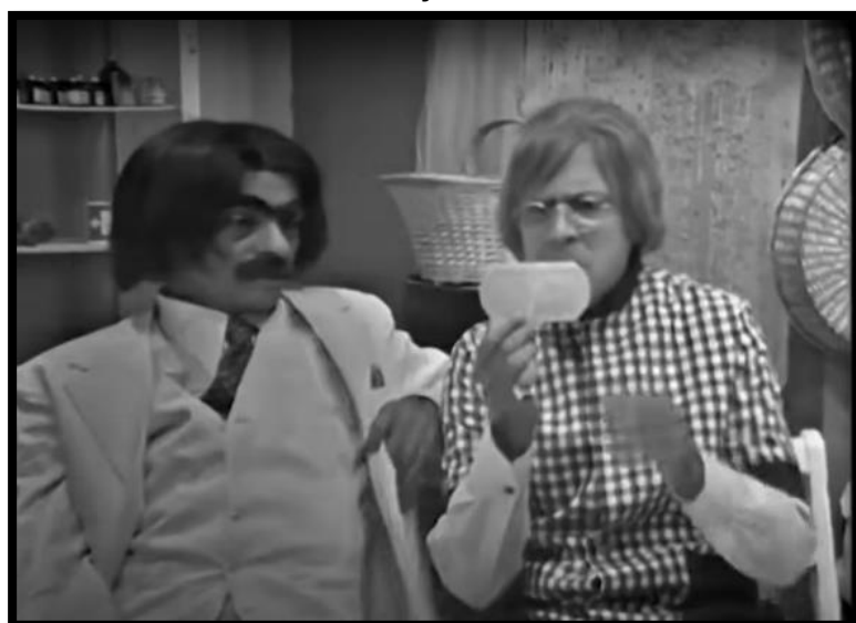
IMAGEM 8 – CANAVIEIRA E A FORÇA QUE SUPERA PROBLEMAS (1973)

As imagens a seguir, extraídas dos quadros humorísticos dos personagens Walfrido Canaveira, Setembrino e Salomé, trazem detalhes das cenas indiciárias em que a piada foi ao ar. Tais como a expressão facial, um jeito de olhar e gesticular dos personagens, tipo de ambiente e outros dados indiciários empregues como recurso estratégico da comicidade para provocar o riso e conquistar audiência.