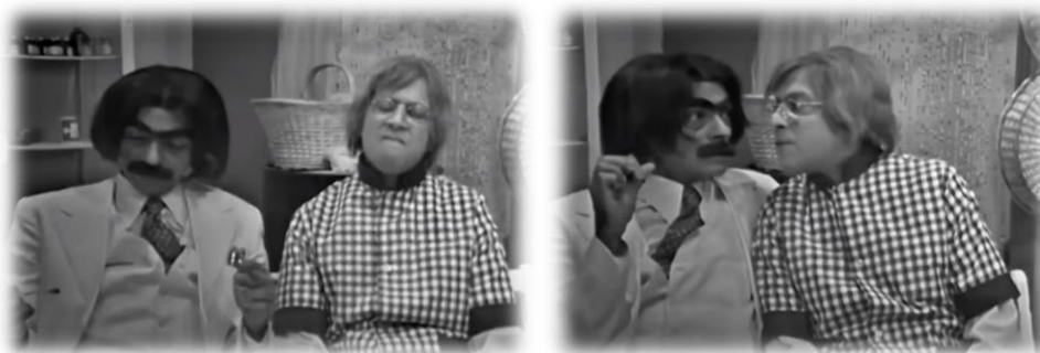
IMAGEM 1 – PERSONAGEM WALFRIDO CANAVIEIRA (1973)

No auge da ditadura vai ao ar o programa de humor Chico City (1973), trazendo como atração o personagem Walfrido Augusto Canavieira. Um tipo criado por Chico Anysio para cumprir o papel de um prefeito populista que escapava das cobranças do povo sobre a situação econômica da cidade, inaugurando a todo instante uma obra pública, ainda que fosse inútil e mal-acabada. Para aqueles eleitores que exigiam o cumprimento das promessas de campanha, o prefeito tinha sempre a resposta pronta: “palavras são palavras, nada mais que palavras” (MemoriaGlobo, 2021f). Para driblar a censura Chico Anysio acrescentou às falas do prefeito: “os outros pensam no País, eu quero é saber só de mim” e, assim evitou cortes e sanções (Anysio, 1990, min 33).